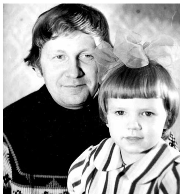
С дочкой. Снимок 1976 года..

По окончании средней школы она поступила в Ярославский государственный университет на эко-